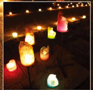
※前回のキャンドルナイトの写真です。